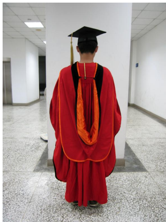
(圖三)博士服樣式(工學院)