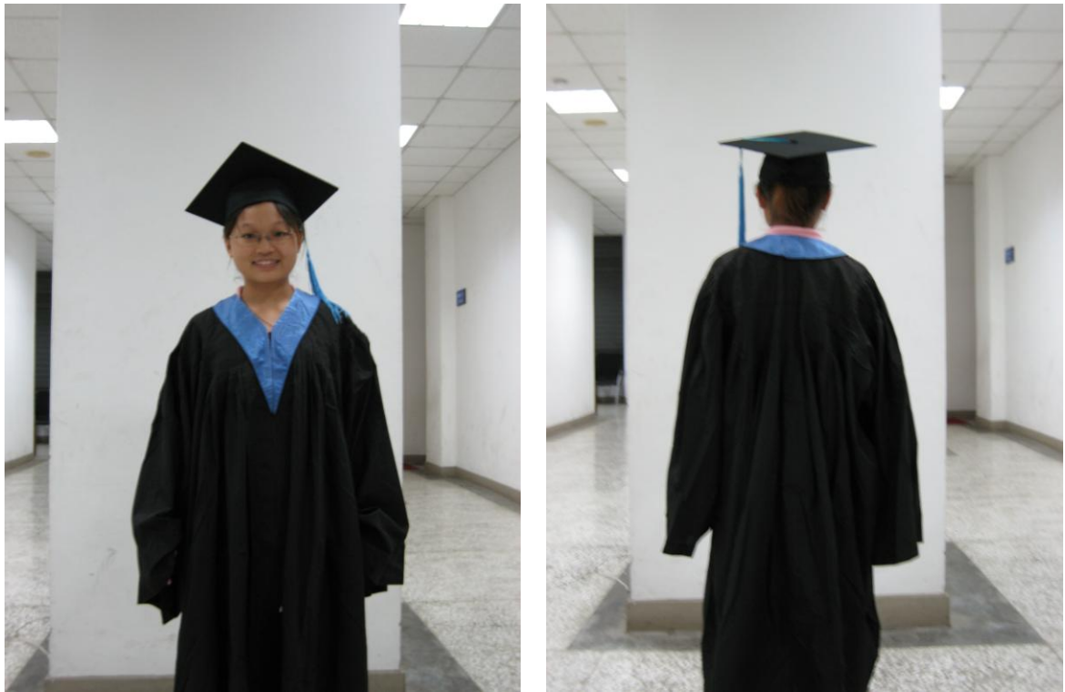
(圖一)學士服樣式(社科院)